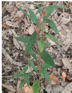
Gambar 3. Rolandra fruticosa

Rolandra fruticosa (Gambar 3) merupakan gulma yang umum ditemukan pada lahan terbuka dan terganggu, termasuk perkebunan. Spesies ini memiliki pertumbuhan cepat dan adaptasi tinggi terhadap kondisi cahaya penuh. Secara fisiologis, R. fruticosa mampu menyerap air dan unsur hara secara efisien melalui sistem perakaran tunggang yang kuat (Bilkis et al., 2022). Dominansinya didukung oleh kemampuan reproduksi generatif yang tinggi, produksi biji melimpah, serta penyebaran yang efektif melalui angin dan aktivitas manusia, sehingga mampu membentuk populasi padat. Selain itu, sistem perakaran yang kuat meningkatkan efisiensi penyerapan sumber daya, sehingga memperkuat daya saing terhadap vegetasi lain.