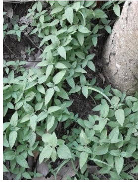
Gambar 4. Asystasia gangetica

Dominansi beberapa spesies invasif menunjukkan bahwa agroekosistem perkebunan karet di lokasi penelitian mengalami tingkat gangguan yang tinggi, sehingga memberi peluang bagi spesies invasif untuk berkembang dan menggantikan spesies lokal. Gulma dengan nilai SDR tinggi berpotensi menekan pertumbuhan tanaman utama melalui kompetisi sumber daya serta mengubah struktur komunitas tumbuhan bawah. Selain itu, beberapa gulma invasif memiliki toleransi terhadap herbisida, sehingga berisiko menimbulkan resistensi jika pengendalian kimia dilakukan berulang tanpa strategi yang tepat. Kondisi ini dapat meningkatkan biaya pengendalian dan menurunkan efisiensi pengelolaan perkebunan dalam jangka panjang.