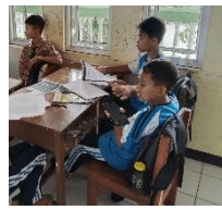
2. Mendesain perancangan proyek dan menyusun jadwal pembuatan