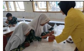
3. Tahap pengolahan data menganalisis percobaan