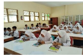
4. Tahap pengumpulan data dengan study literature