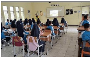
1. Tahap identifikasi masalah berbasis kearifan lokal

Integrasi PjBL–Etno-STEM berbasis kearifan lokal terbukti mendorong peningkatan kreativitas produk, meskipun belum mencapai kategori Outstanding . Pengamatan menunjukkan bahwa kelas eksperimen lebih aktif dalam diskusi, modifikasi desain, dan eksplorasi bahan (Gambar 3a), sedangkan kelas kontrol lebih berfokus pada pemahaman konsep melalui tahapan Discovery Learning (Gambar 3b). Namun, interpretasi ini perlu hati-hati karena tidak didukung observasi sistematis menggunakan instrumen khusus.