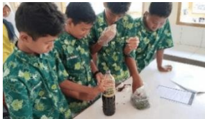
3. Tahap pelaksanaan proyek pembuatan produk