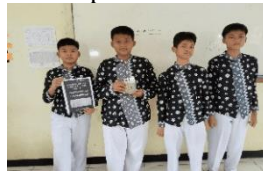
4. Tahap Refleksi berkala, Presentasi produk, dan publikasi