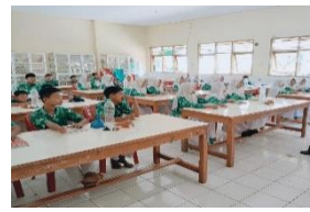
3. Sintaks simulation dan problem statement dengan guru IPA