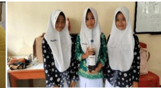
4. Tahap verification and kesimpulan